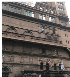
2018年12月2日、カーネギーホール