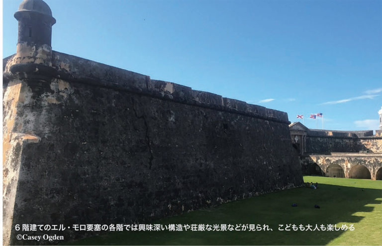
6階建てのエル・モロ要塞の各階では興味深い構造や荘厳な光景などが見られ、子ども大人も楽しめる