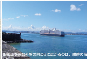
旧市街を囲む外壁の向こうに広がるのは、紺碧の海