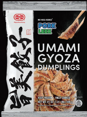
PORK & LEEK