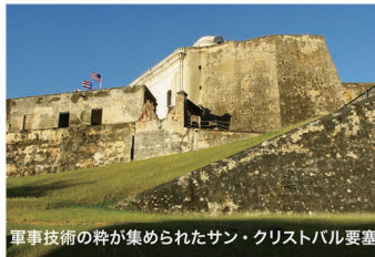
軍事技術の粋が集められたサン・クリストバル要塞