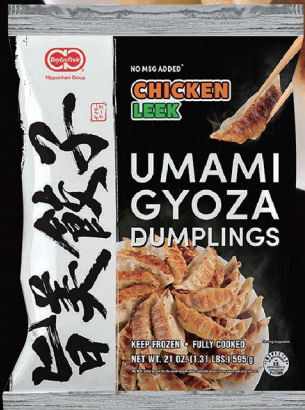
CHICKEN & LEEK