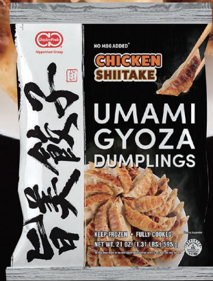
CHICKEN & SHIITAKE